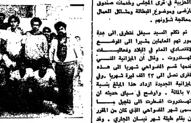
فريق مدرسة هشام الثانوية الذي فاز بكأس البطولة